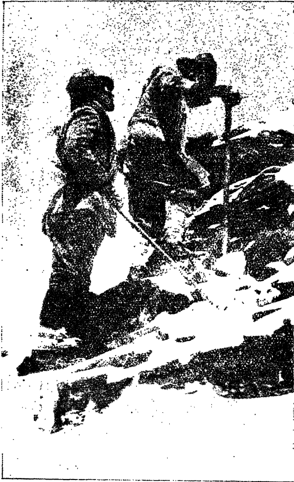
मलेरी और नार्टन